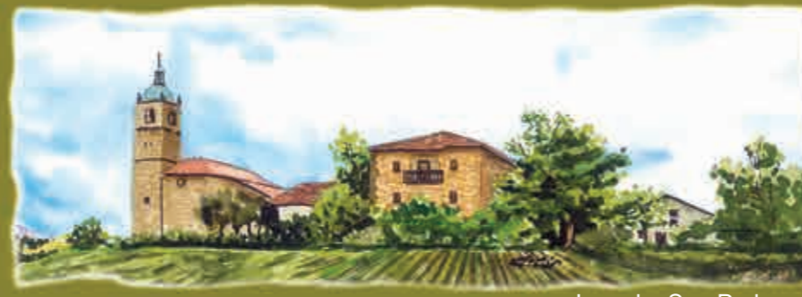
Lumo San Pedro de Lumo