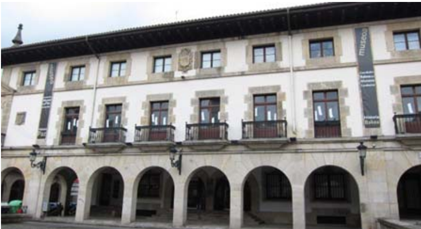
El Museo de la Paz de Gernika (Vizcaya) acabó el pasado

año con 29.000 visitantes, lo que supone un incremento del 7,4 por ciento respecto al ejercicio anterior. Esta cifra confirma el "tirón que el museo está teniendo". Se trata de una instalación, abierta en 1998 y que este año conmemorará el 75º aniversario del Bombardeo de Gernika (1937-2012), según han informado sus responsables.